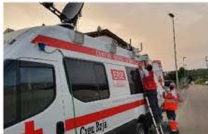
Comunicacions i Coordinació