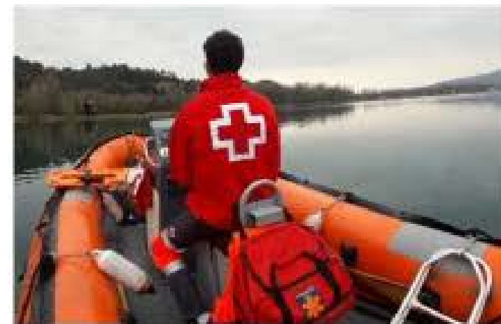
Recerca i Salvament en Medi Aquàtic