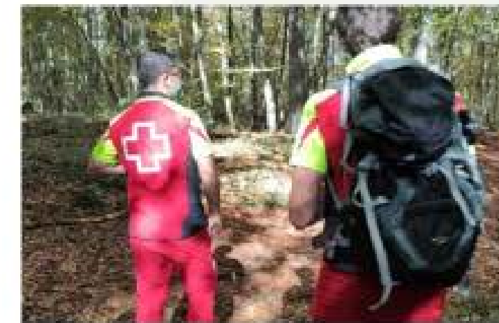
Recerca i Salvament en Medi Terrestre