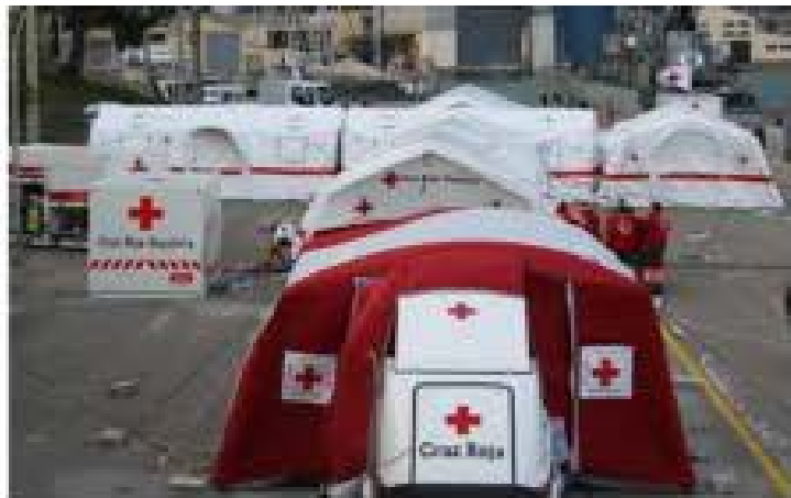
Assistència Sanitària i classificació de víctimes