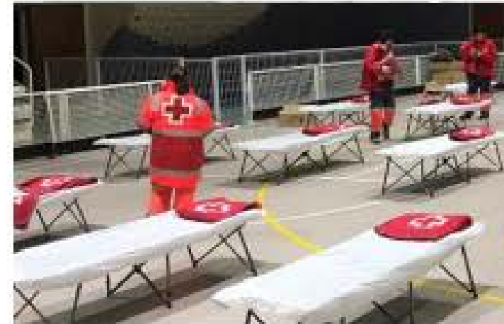
Alberg Provisional i Avituallament