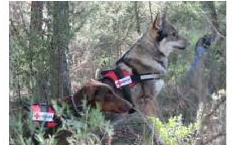
Recerca i Rastreig amb Gossos