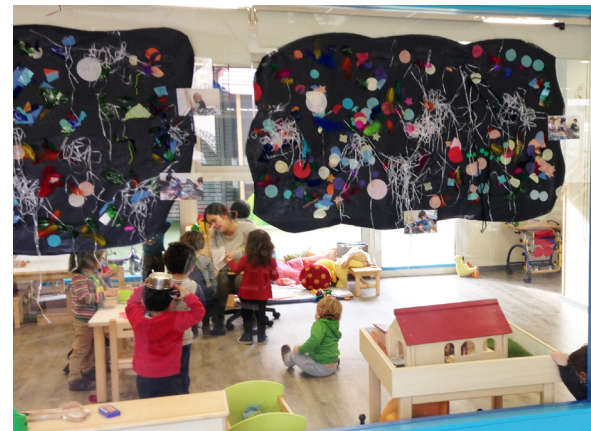
Escola bressol municipal Trencadís (Barcelona).

És essencial, doncs, prendre consciència que sempre i en tot moment s'està acompanyant les criatures, en tot el que es fa i en com es fa, però també en el que no es fa.