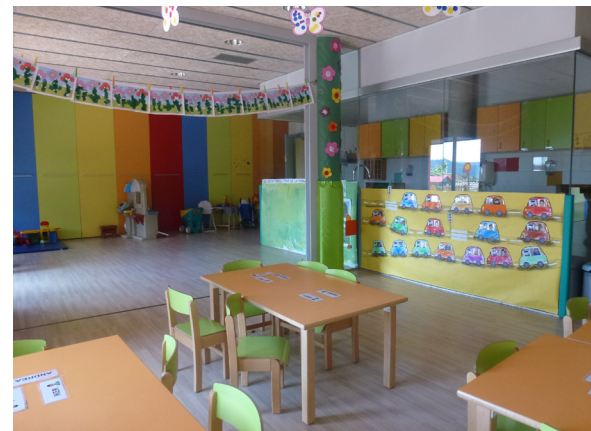
Llar d'infants municipal Sant Marc (Balsareny).