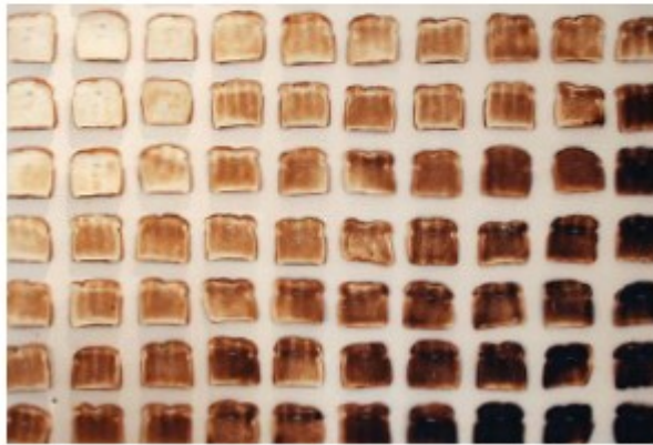
"Taxonomia da color" - Andrea Mestre