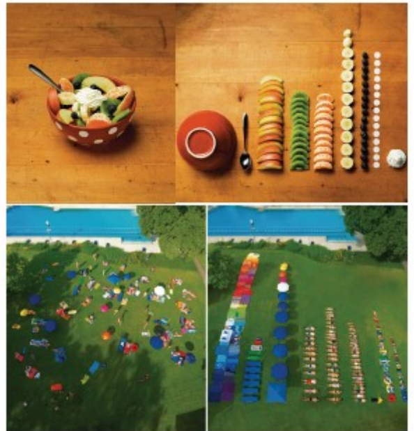
'Art of Clean Up' - Ursus Wolf's