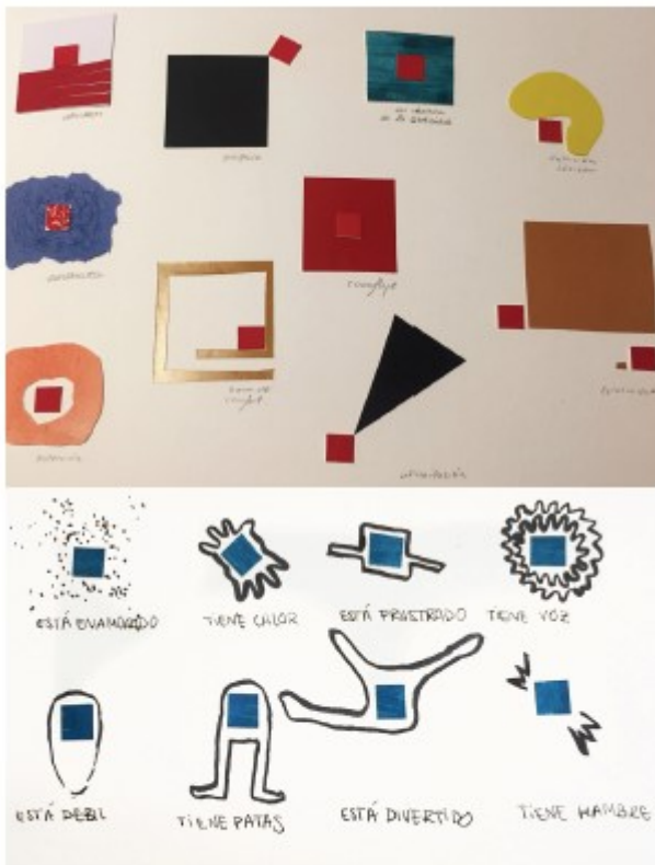
Concepts, color i amor d'ènim