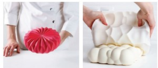
Dinara Kac o- Color i forma