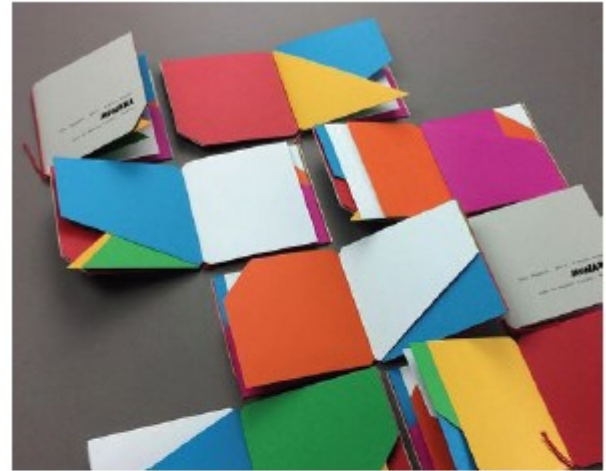
"Libro Illegibile" - Bruno Munari