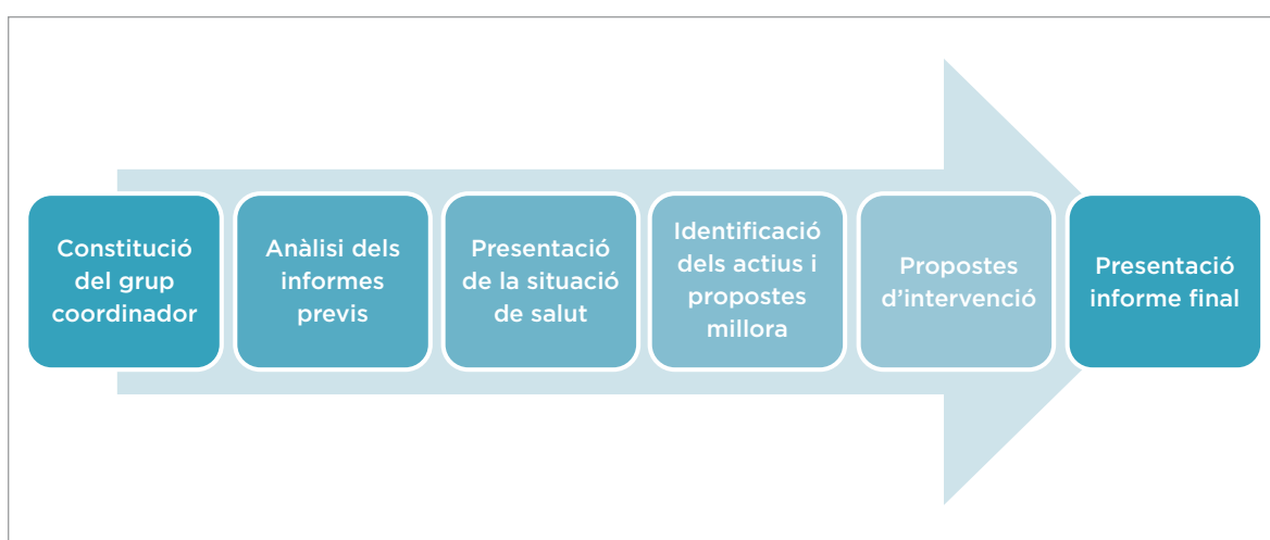
Figura 2 - Proposta de planificació per a l'elaboració del Pla de Salut 2016-2020

Aquest Pla de salut s'ha elaborat a partir d'un procés metodològic que consta de 6 fases que s'exposen a continuació (Figura 2):