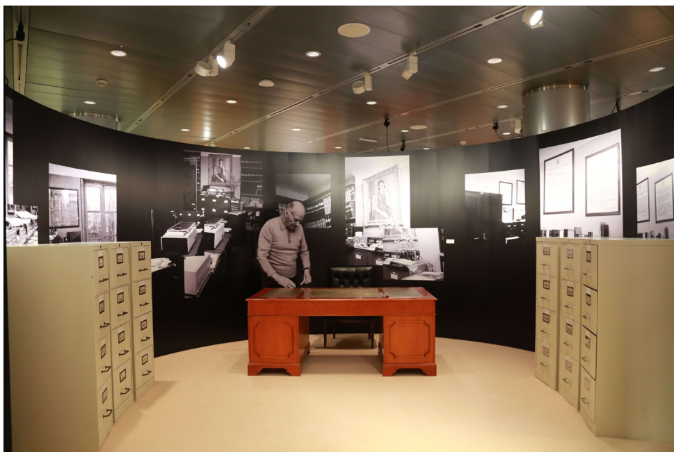
Exposició "Els fonaments de l'autogovern. Arxiu Montserrat Tarradellas i Macià". Recreació del despatx del president Tarradellas.