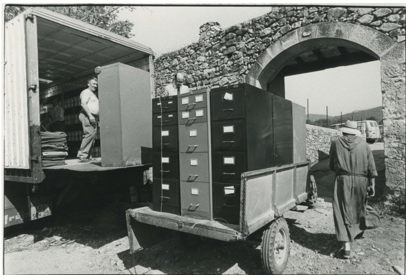
Arxiu Montserrat Tarradellas i Macià. Trasllat de l'Arxiu cap a Poblet.

L'aleshores secretari general d'ERC va ser detingut el desembre del 1940. L'agost del 1941, de nou, va passar un mes a la presó amb risc d'extradició a l'Espanya de Franco, per seguir el mateix destí de Lluís Companys, que fou detingut a la Bretanya, lliurat al franquisme i afusellat al castell de Montjuïc l'octubre del 1940. Davant d'aquesta situació, i tement per la vida dels seus pares, va demanar al pare que destruís tota la documentació que li havia dut a Clos Mosny.