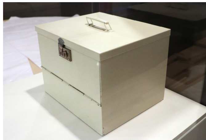
Imatge de la capsa que contenia l'urna que va custodiar el cor del president Macià i que es pot veure a la mostra.