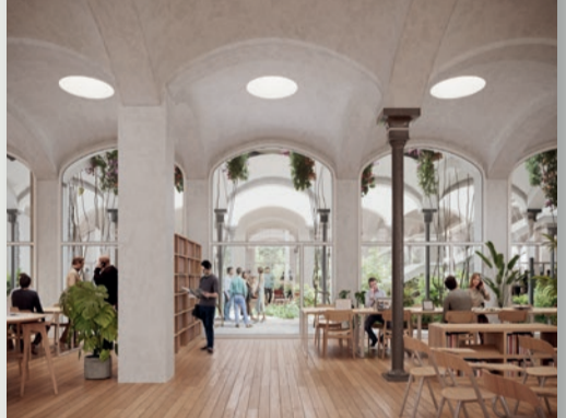
Recuperación de la sala de telares, de Guastavino, como espacio de investigación