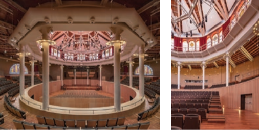
Paraninfo de la Escuela Industrial recuperado como centro de reuniones

Centro de reuniones del Paraninfo con 11 salas