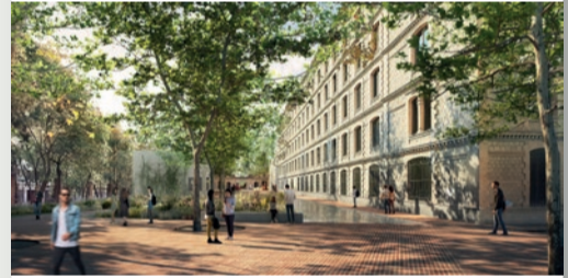
Placeta de los Filadores

Rehabilitamos los edificios para conseguir que sean de consumo casi nulo (nZBE)