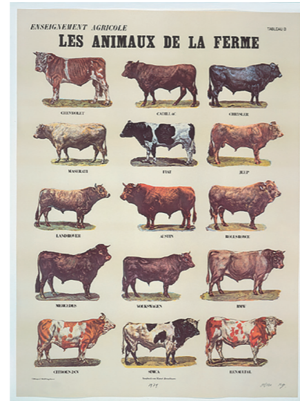
MARCEL BROODTHAERS Les Animaux de la ferme [detall] 1974 Col·lecció MACBA. Fundació MACBA © Estate of Marcel Broodthaers, VEGAP, Barcelona, 2017

Seguint aquestes premisses, «Entusiasme. El repte i l'obstinació en la Col·lecció MACBA» proposa cinc aproximacions possibles basades en l'acte entusiasta: la construcció cosmogònica, la potència creativa de la vida quotidiana, la càrrega performativa del cos, l'activisme de caràcter social i la posada en crisi de la pròpia noció d'art. D'aquesta manera, la voluntat d'artistes com Zush, Anne-Lise Coste o Younès Rahmoun per construir un món propi mitjançant vivències, fantasies o creences; la repetició de gestos simples i quotidians d'Esther Ferrer, Ignasi Aballí, Dieter Roth, Richard Hamilton o Tere Recarens; la performativitat de Vito Acconci o Àngels Ribé; l'acció inconformista de Maja Bajevic, Emanuel Licha, Mireia Sallarès, Cildo Meireles o Gordon Matta-Clark, i, finalment, la crítica al propi sistema de l'art de figures de Marcel Broodthaers o Peter Friedl suggereixen una seqüència narrativa en què l'entusiasme denota una posició ideològica forta