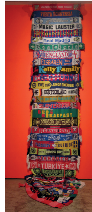
TERE RECARENS Fucking Glory 2007 Col·lecció MACBA. Fundació MACBA. Col·lecció Fundació Repsol © Tere Recarens, 2017 Fotografia: Cortesia Galeria Toni Tàpies

enfront del fet artístic: aquella que, al cap i a la fi, concep l'art com un acte de fe capaç d'assolir el que es proposa, ja sigui canviar el món o simplement qüestionar-se a si mateix.