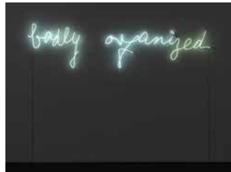
PETER FRIEDL Untitled (Badly Organized) 2003 Col·lecció MACBA. Fundació MACBA. Donació de l'artista © Peter Friedl, 2017

En termes generals, l' entusiasme s'entén com un procés subjectiu d'exaltació de l'ànim, en què la passió i el fervor actuen com a detonant emocional d'allò que —ja sigui discret o ambiciós, íntim o públic— es vol aconseguir. Mitjançant una anàlisi plural del concepte, el projecte revisa la col·lecció del MACBA amb l'objectiu d'escenificar i contrastar tot un seguit de comportaments i actituds sensibles a aquesta excitació. Una posició ferma i obstinada que s'allunya d'actituds ingènues o simplement alegres i aposta per qüestions de confiança, resistència i furor a diferents nivells. L'exposició proposa un exercici d'activació de les obres, en què s'entrecreen causes i desafiaments diversos, cosa que dona lloc a una selecció de reptes singulars que, situats dins de l'àmbit de l'art contemporani, transiten entre les obsessions individuals i els compromisos d'ordre estètic, social o polític.