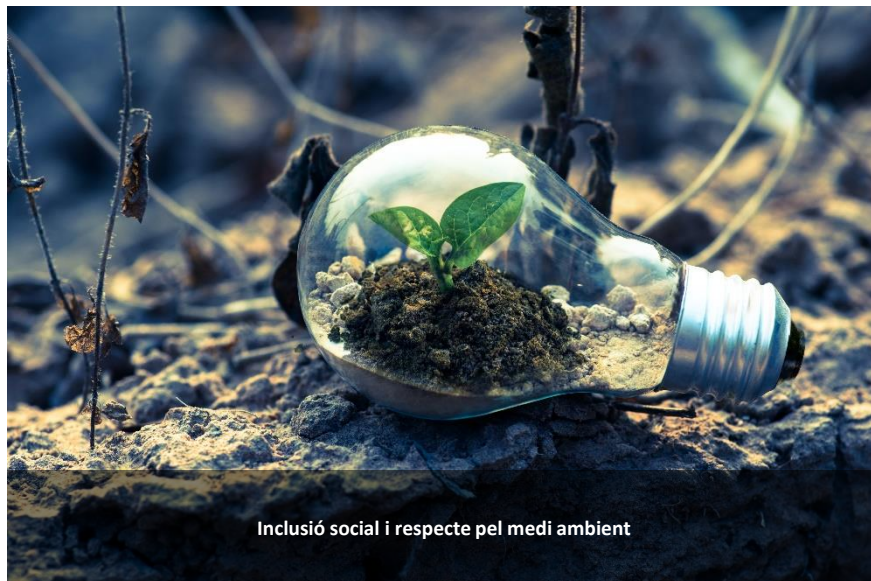
Inclusió social i respecte pel medi ambient