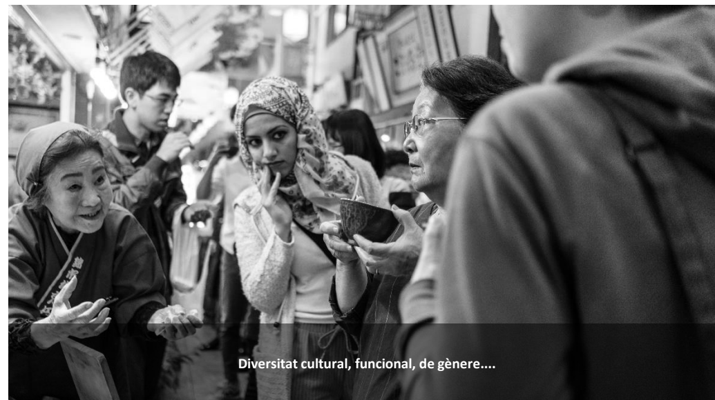
Diversitat cultural, funcional, de gènere....